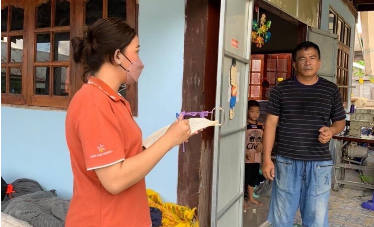
ภาพที่ 4.13 ทีมงานนักวิจัยลงพื้นที่แจกแบบสอบถามในเขตองค์การบริหารส่วนตำบลดงลาน อำเภอสีชมพู (13)