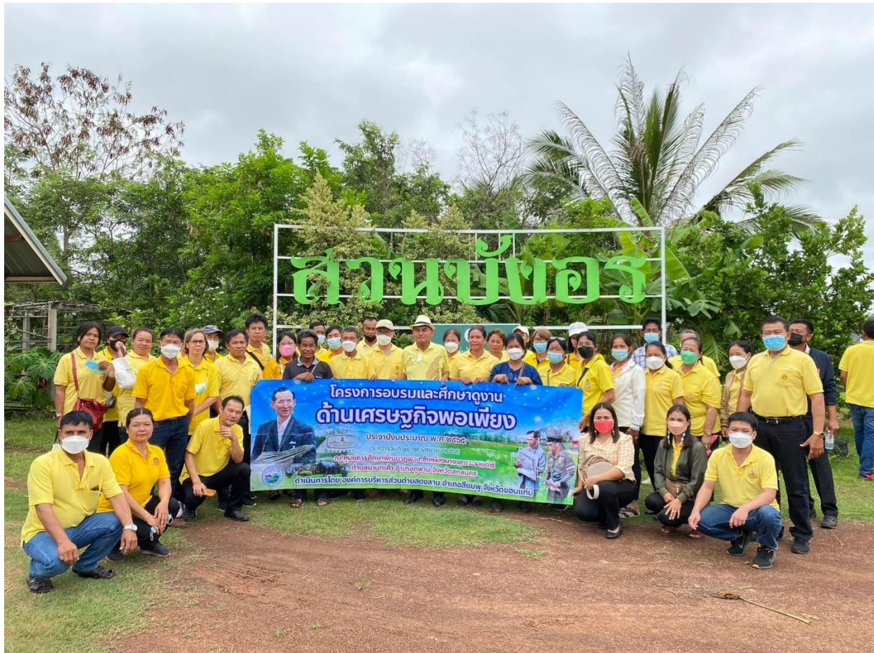
ภาพที่ 4.1 กิจกรรม/โครงการขององค์การบริหารส่วนตำบลดงลาน อำเภอสีชมพู (1)

ด้านการเข้าร่วมกิจกรรม/โครงการที่จัดโดยองค์กรปกครองส่วนท้องถิ่นในเขตพื้นที่ ในช่วง ปีงบประมาณ 2565 พบว่า ส่วนใหญ่เคยเข้าร่วมกิจกรรม/โครงการ ร้อยละ 95.0 และไม่เคยเข้าร่วมกิจกรรม/โครงการ ร้อยละ 5 สุดท้าย ด้านการทำแบบสำรวจและประเมินความพึงพอใจในการให้บริการขององค์กรปกครองส่วนท้องถิ่น พบว่า กลุ่มตัวอย่างเคยทำแบบสอบถามประเมินความพึงพอใจการให้บริการขององค์กรปกครองส่วนท้องถิ่น ร้อยละ 95 รายละเอียดตามตารางที่ 4.1