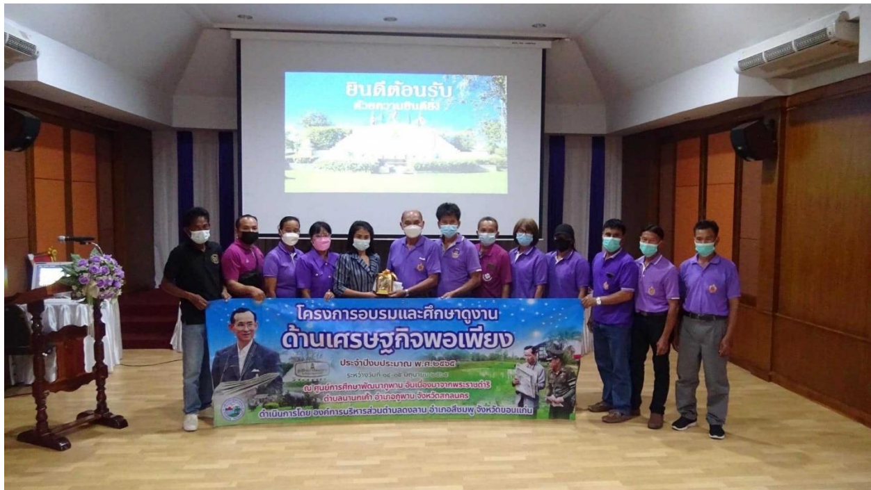
ภาพที่ 4.4 กิจกรรม/โครงการขององค์การบริหารส่วนตำบลดงลาน อำเภอสีชมพู (4)